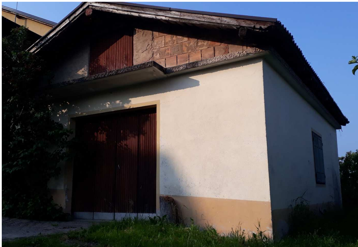
Vista da nord