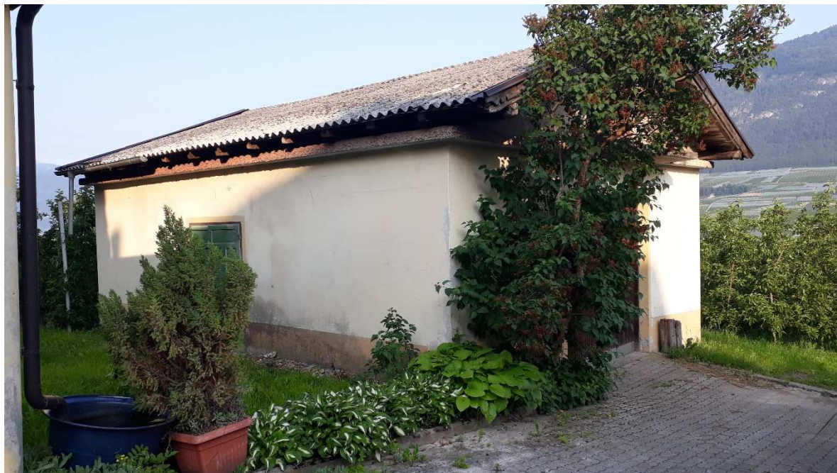
Vista da est